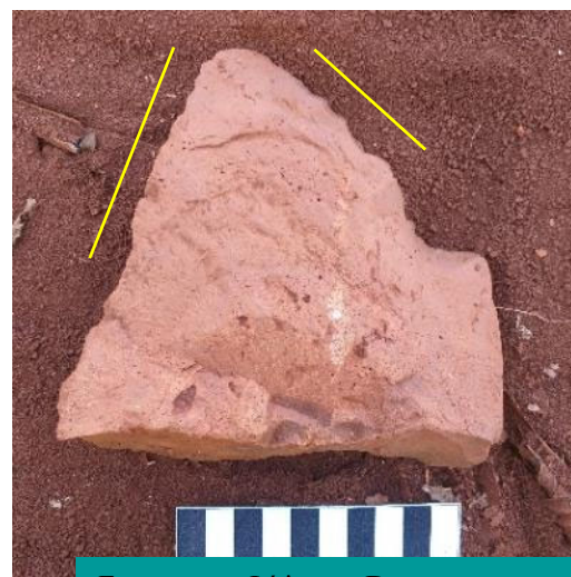
Ferramenta Lítica – Destaque para na área de retoque. S. A. Água Boa 1