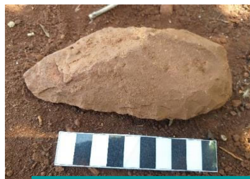
Ferramenta Plano-convexo em Arenito Sítio Arqueológico Água Boa 1

Também chamado de "lesma", são ferramentas pré-históricas cortantes, com formato peculiar, tendo uma face "plana" e a outra "convexa", podendo ser usada como faca, raspador e diversos fins.