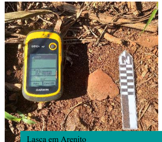
Lasca em Arenito